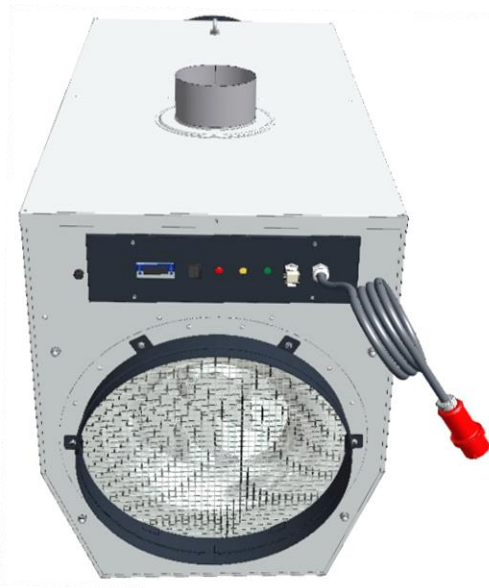
HLF-120 RM Ventilatoransicht mit Umluftanschluss