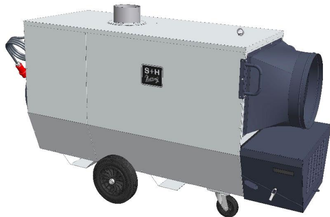
HLF-120 RM Seitenansicht